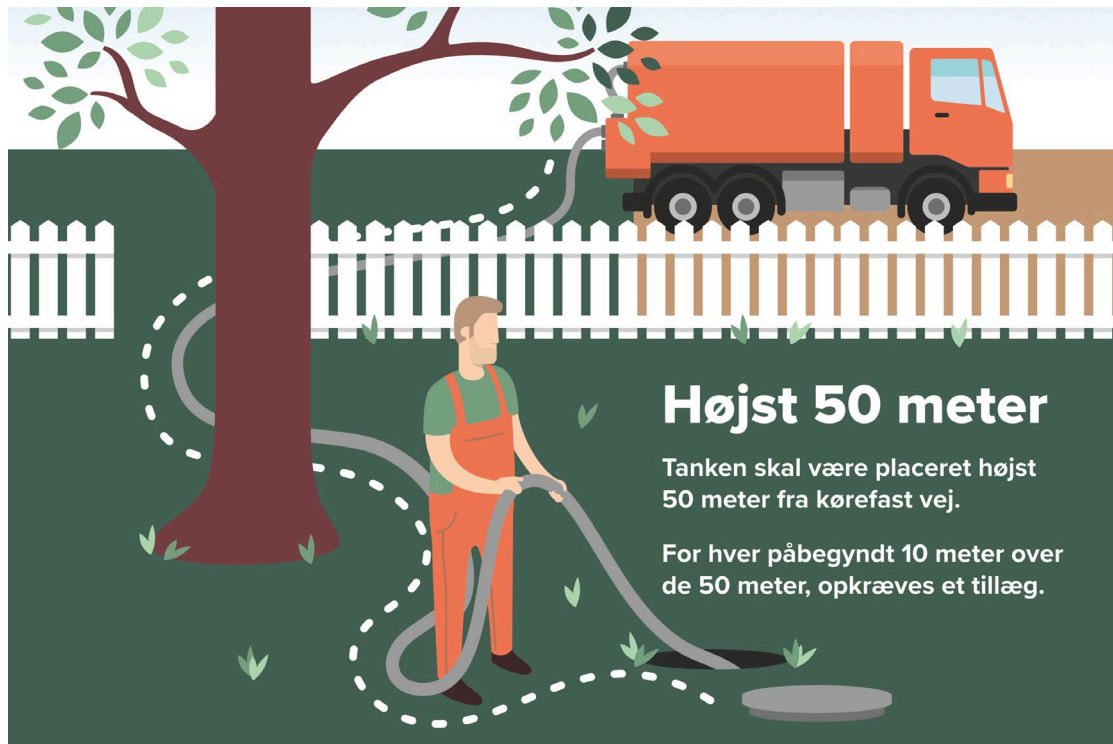
Fig. 3: Adgangsforhold hen til tanken samt slangelængde