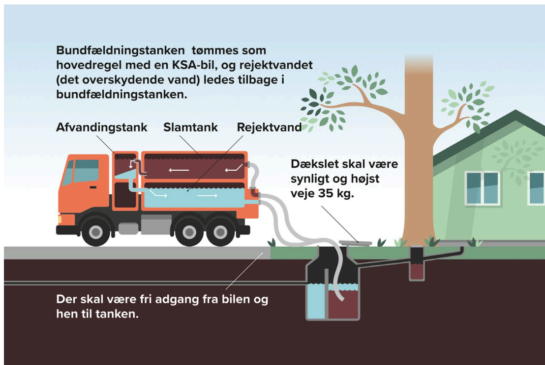
Fig. 4: Kombineret Slam Afvanding med KSA-bil